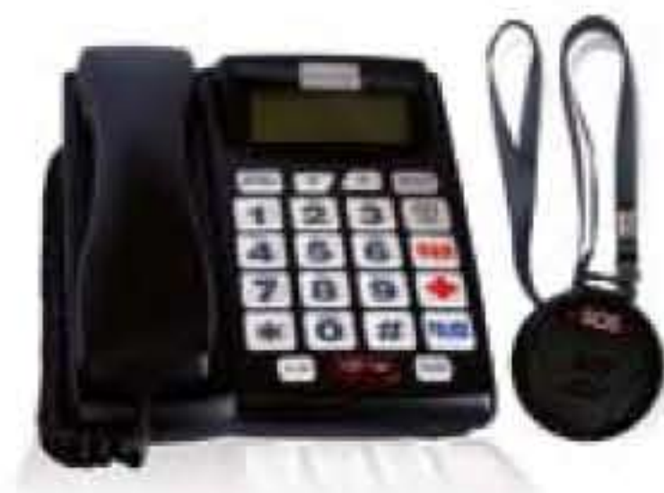
ECS 1000 Notruftaste mit Sprachübertragung im Handsender