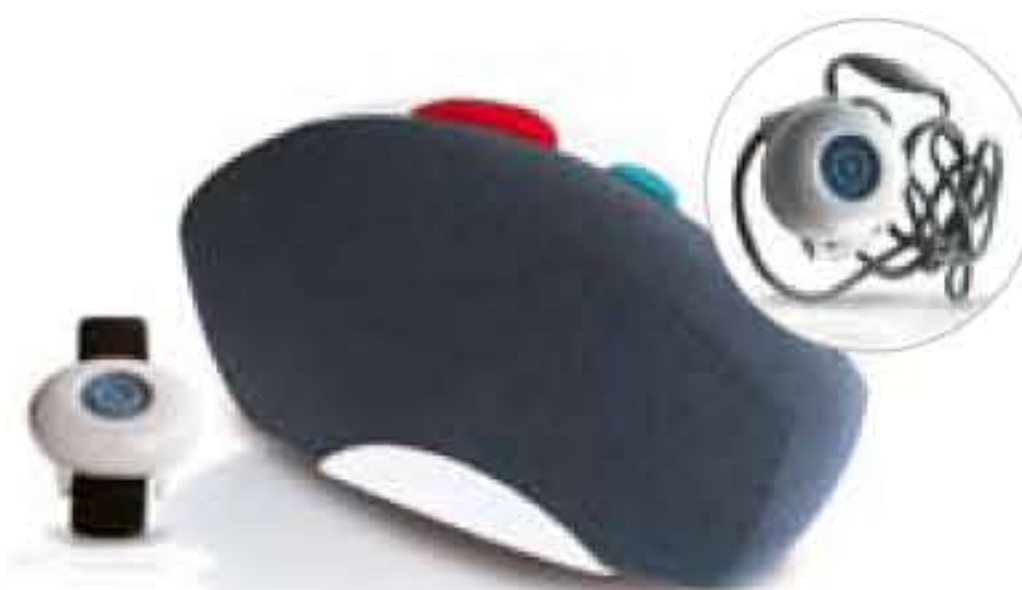
Attendo classic Basisstation mit Handsender