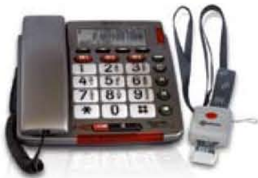
Amplicom powertel 50 alarm plus Komforttelefon mit Handsender