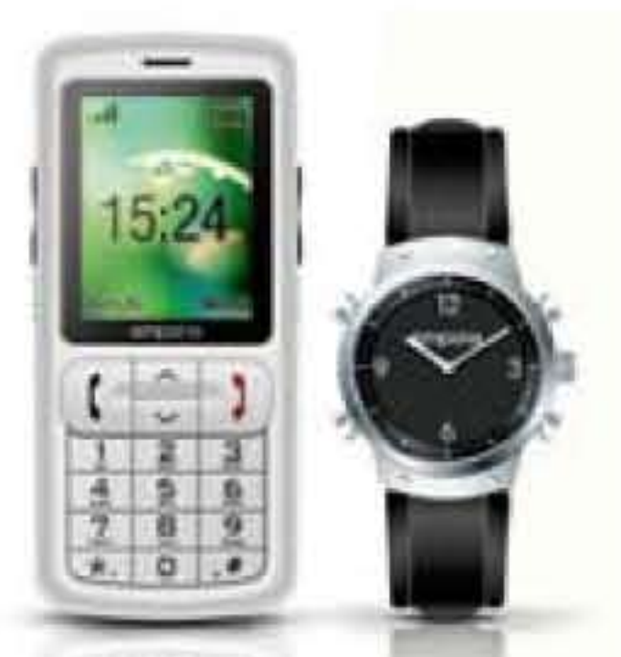
emporia safety plus Handy und Uhr mit Notruftaste zzgl. 249,95 Euro