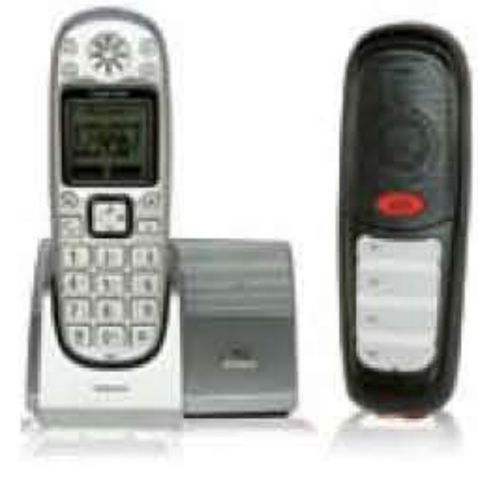
Hagenuk Big 950 aDECT Telefon mit Notruftaste