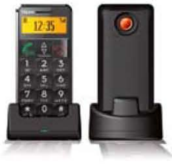
emporia C 115 Handy mit rückseitiger Notruftaste